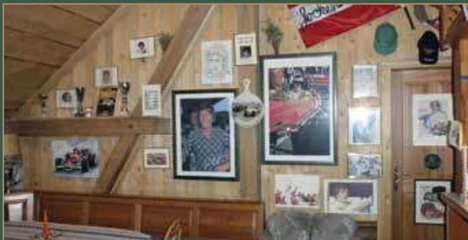
Jochen Rindt Sammlung